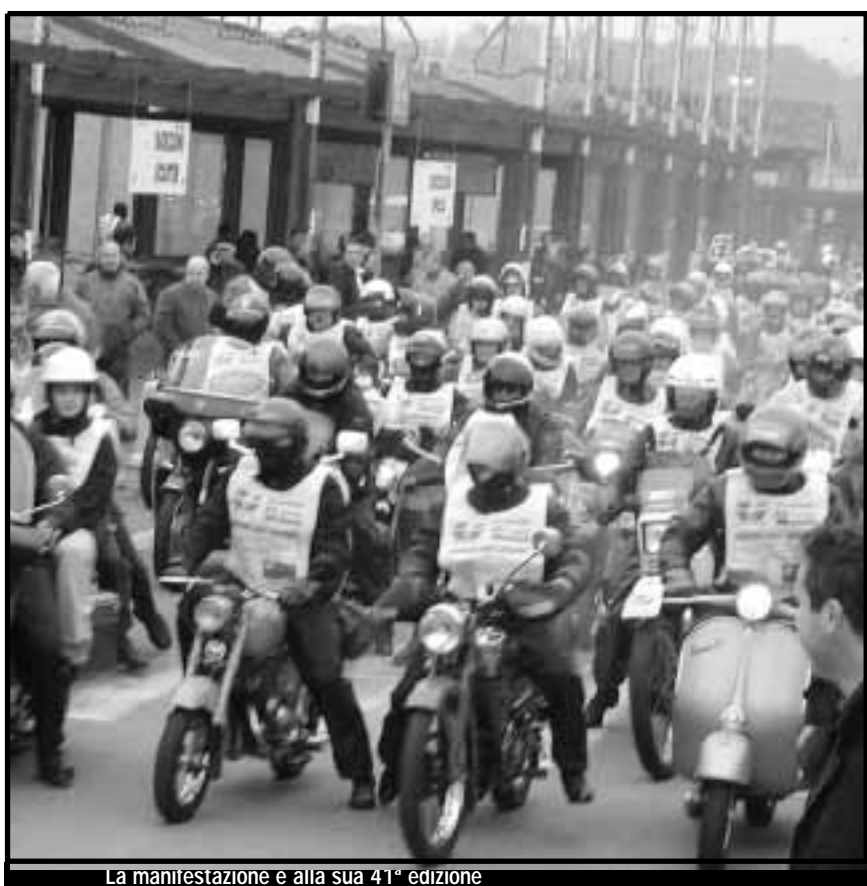
La manifestazione e alla sua 41ª edizione

■ C'è impazienza tra le file del consistente e variegato popolo degli appassionati di motociclismo. È infatti al conto alla rovescia la 41ª edizione della Cavalcata delle Valli Oroliche, la più coinvolgente e affermata non competitiva del settore, una festosa kermesse autunnale capace di coinvolgere anche tremila centauri, che è in programma domenica. L'appuntamento non si ripete dal 2001 in quanto negli ultimi due anni gli organizzatori del Moto Club Bergamo hanno incontrato insormontabili difficoltà per ottenere i permessi di transito nei tratti fuoristrada e quindi non l'hanno potuta riproporre. È stata un'assenza che non è passata inosservata ma che - a giudicare almeno dai telefoni, roventi da giorni, della segreteria del sodalizio - non ha generato disaffezione, anzi, pare averne rinforzato la carica e averla rigenerata. Rispetto a tre anni fa si è voltato pagina. Dopo alcune fortunate edizioni che hanno avuto quale fulcro la località camuna di Borno, per la Cavalcata 2004 si è tornati sui propri passi, su tracciati interamente in terra bergamasca, in particolare per l'enduro (la disciplina d'elezione per la non competitiva) su quel greto del torrente Valeygia, tra Rovetta e Songavazzo, dove si è dato il la per tante volte alla festosa escursione, contando stagione