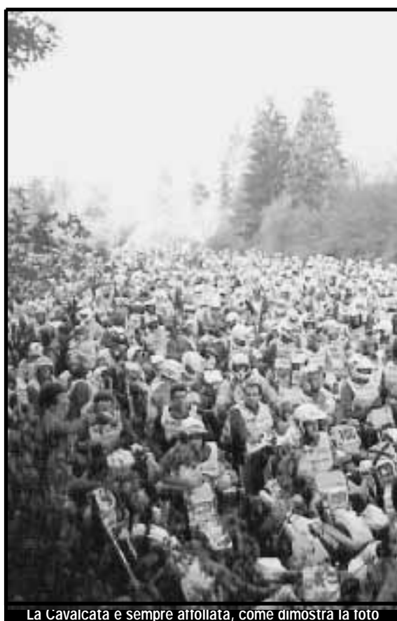
La Cavalcata e sempre affollata, come dimostra la foto

dopo stagione un numero crescente di partecipanti. Il punto di arrivo finale, quello dove convergeranno tutti i motociclisti, puntualmente divisi in cinque gruppi (enduro, trial, strada, epoca e ciclomotori), rappresenta poi una novità assoluta. Si tratta di Valbondione, all'estremità dell'Alta Val Seriana, ed esattamente al palazzetto dello sport.